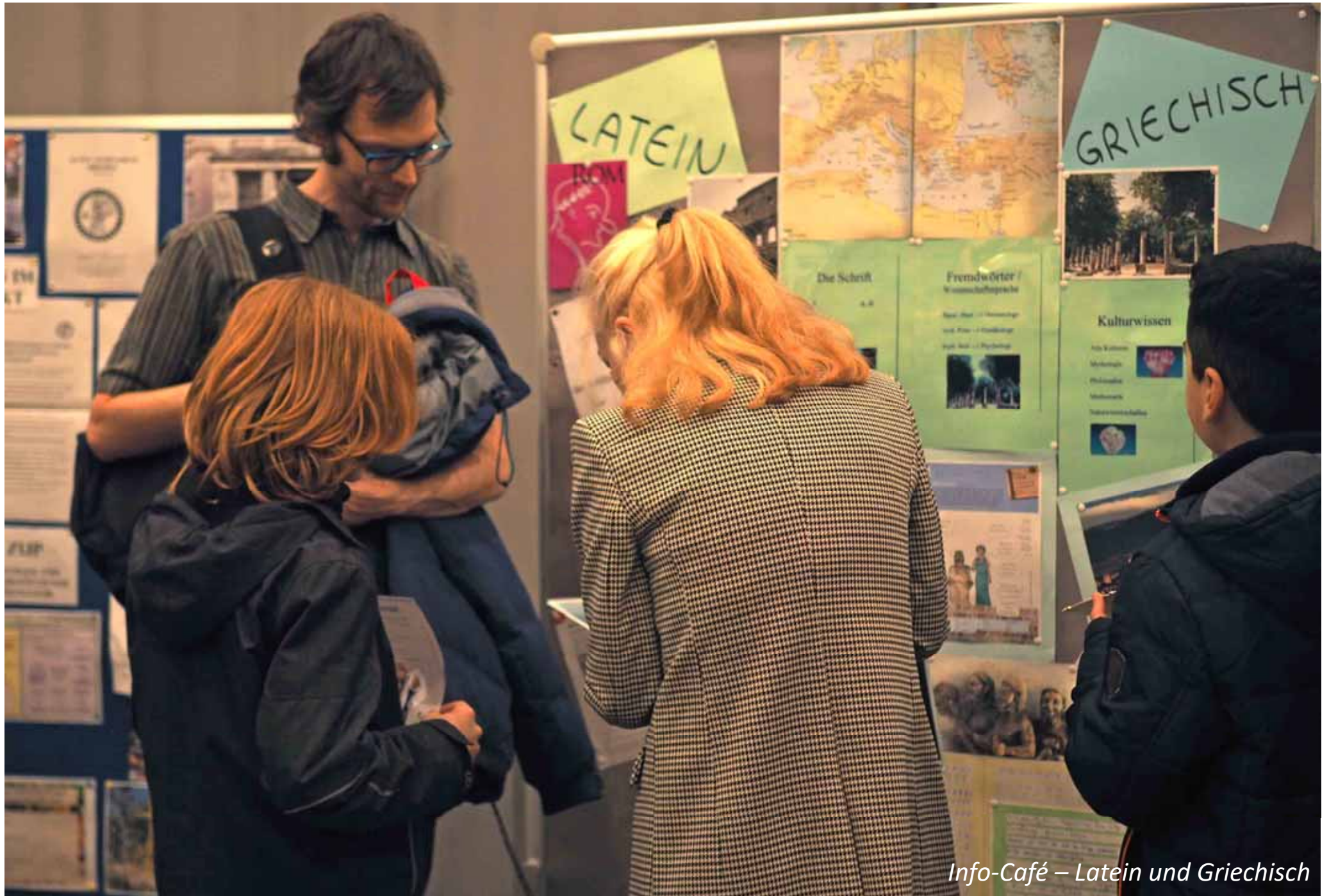
Info-Café – Latein und Griechisch