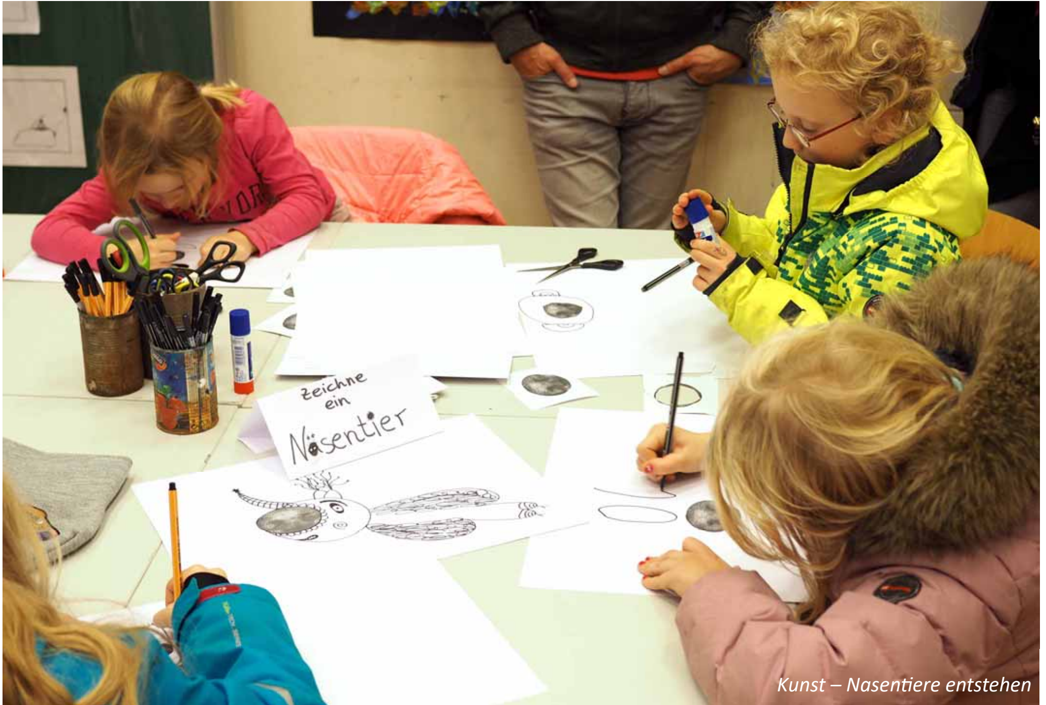
Kunst – Nasentiere entstehen