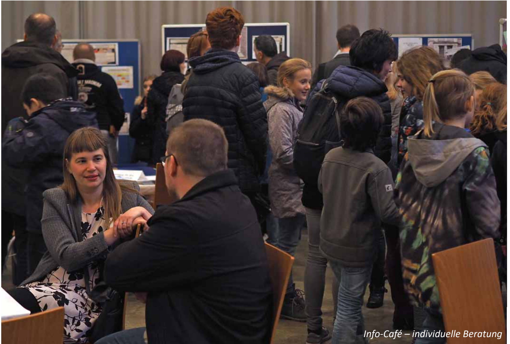
Info-Café – individuelle Beratung