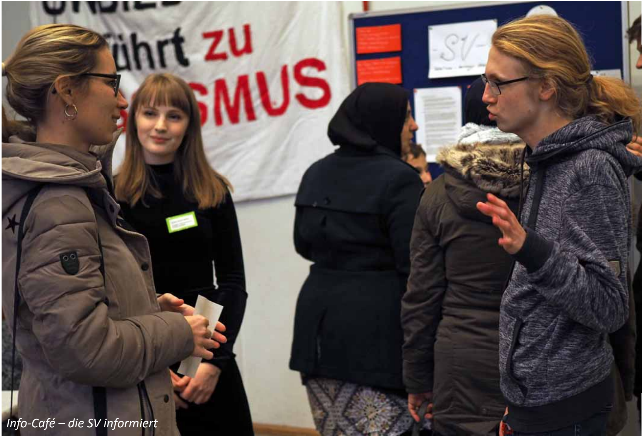
Info-Café – die SV informiert