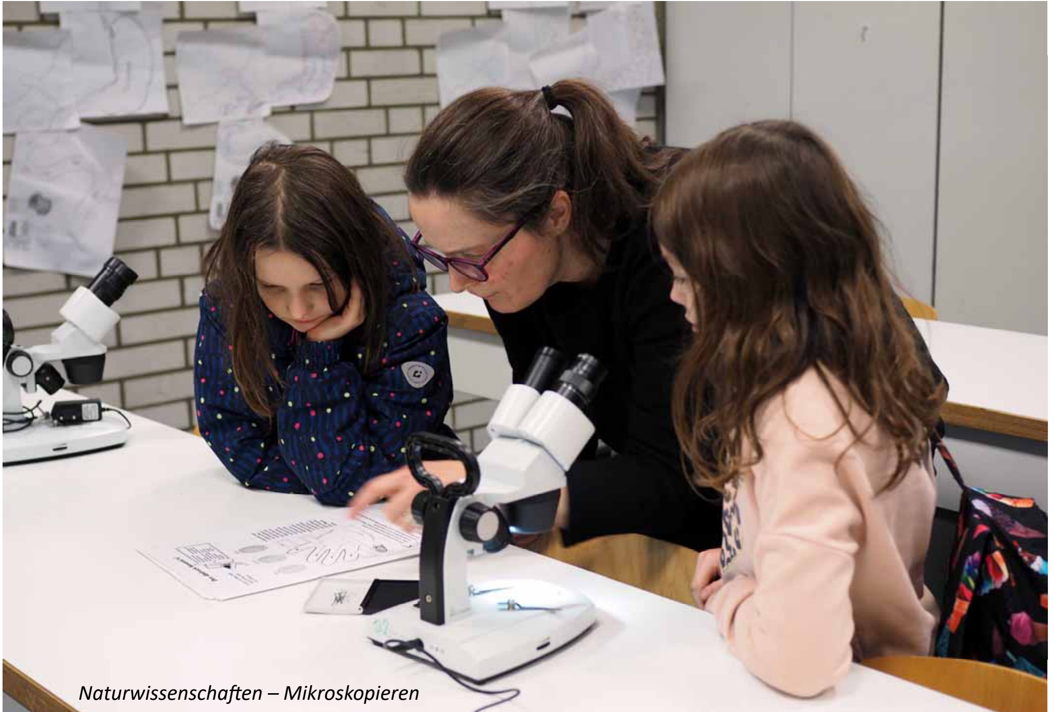
Naturwissenschaften – Mikroskopieren