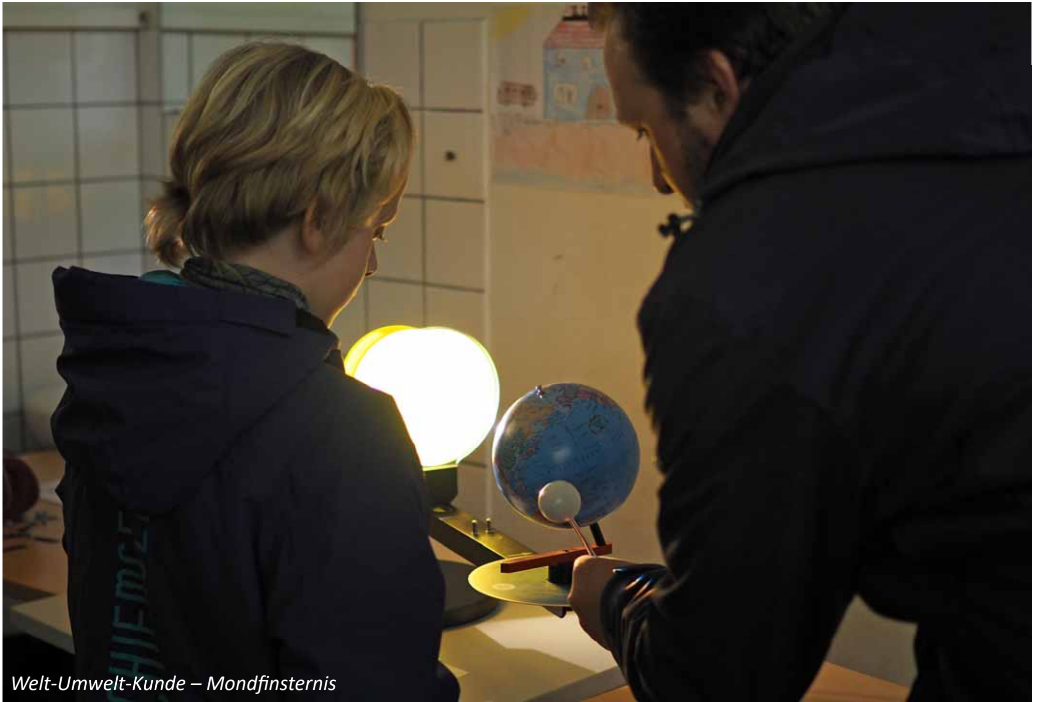
Welt-Umwelt-Kunde – Mondfinsternis