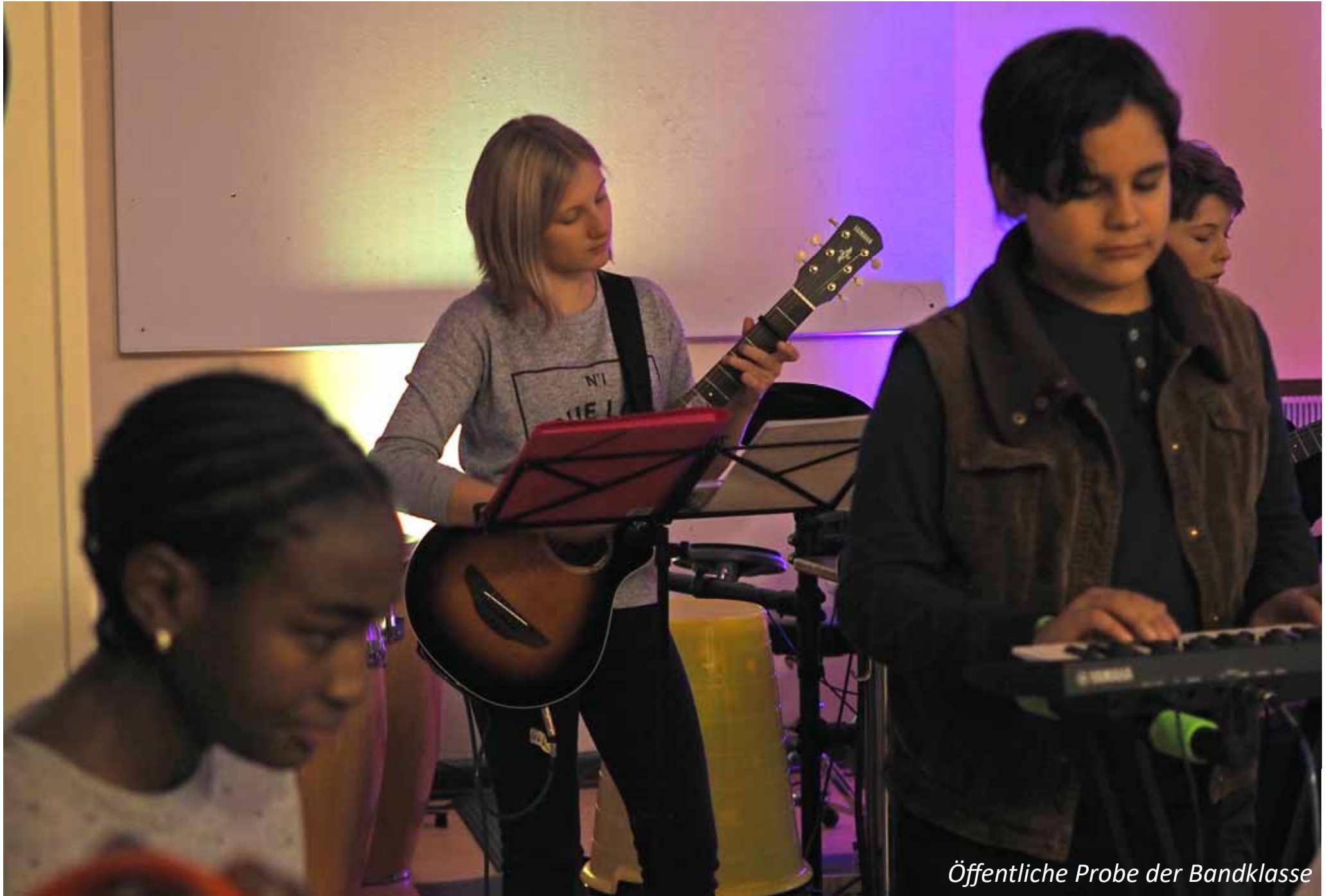
Öffentliche Probe der Bandklasse