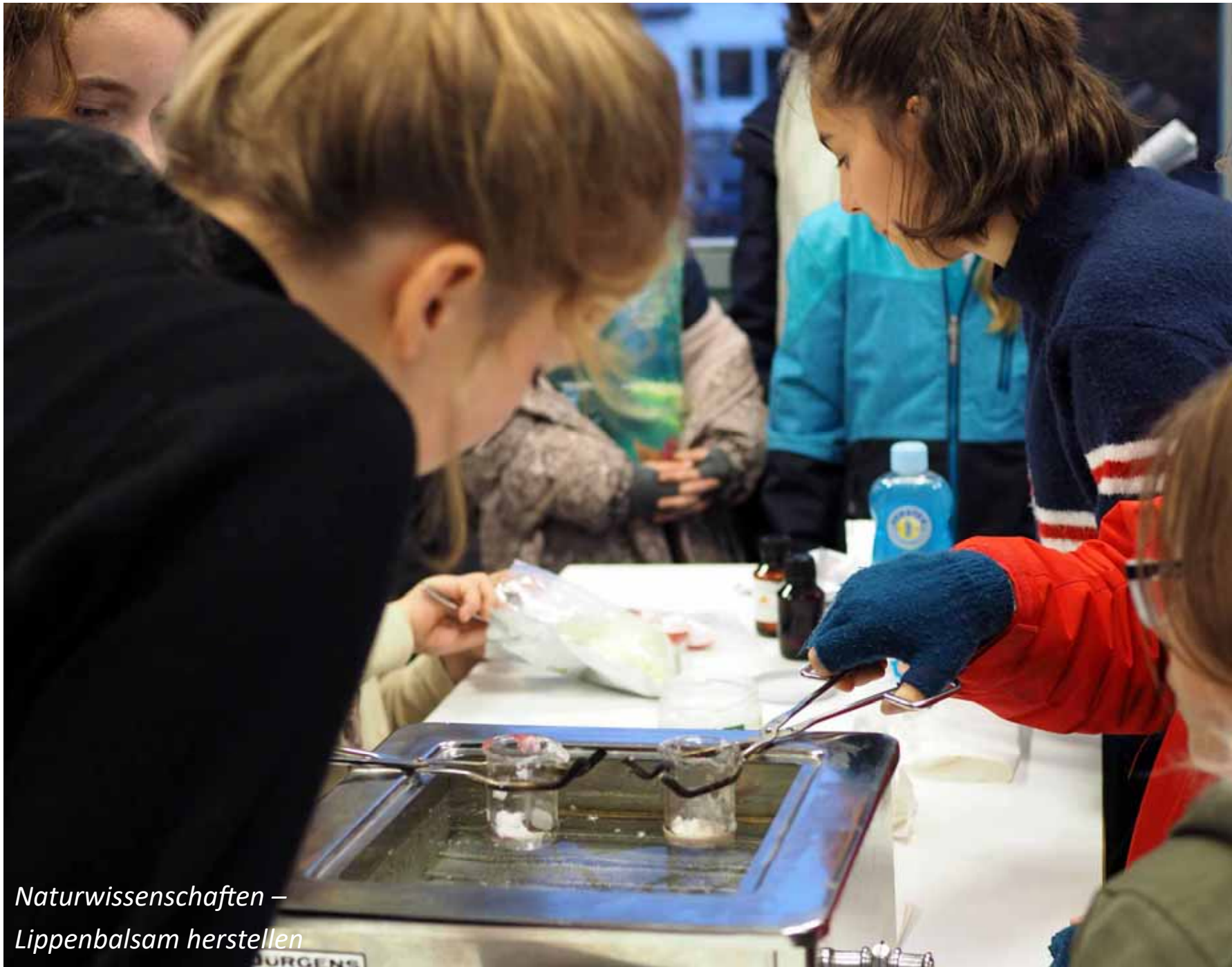
Naturwissenschaften – Lippenbalsam herstellen