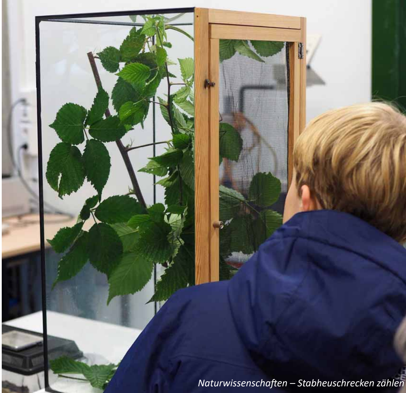
Naturwissenschaften – Stabheuschrecken zählen