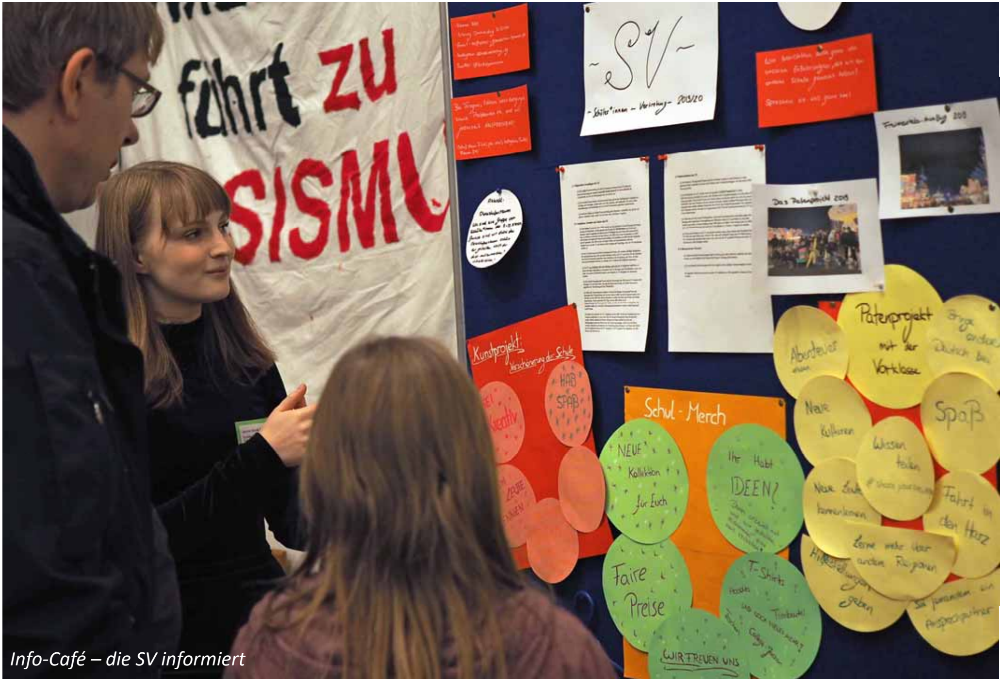
Info-Café – die SV informiert