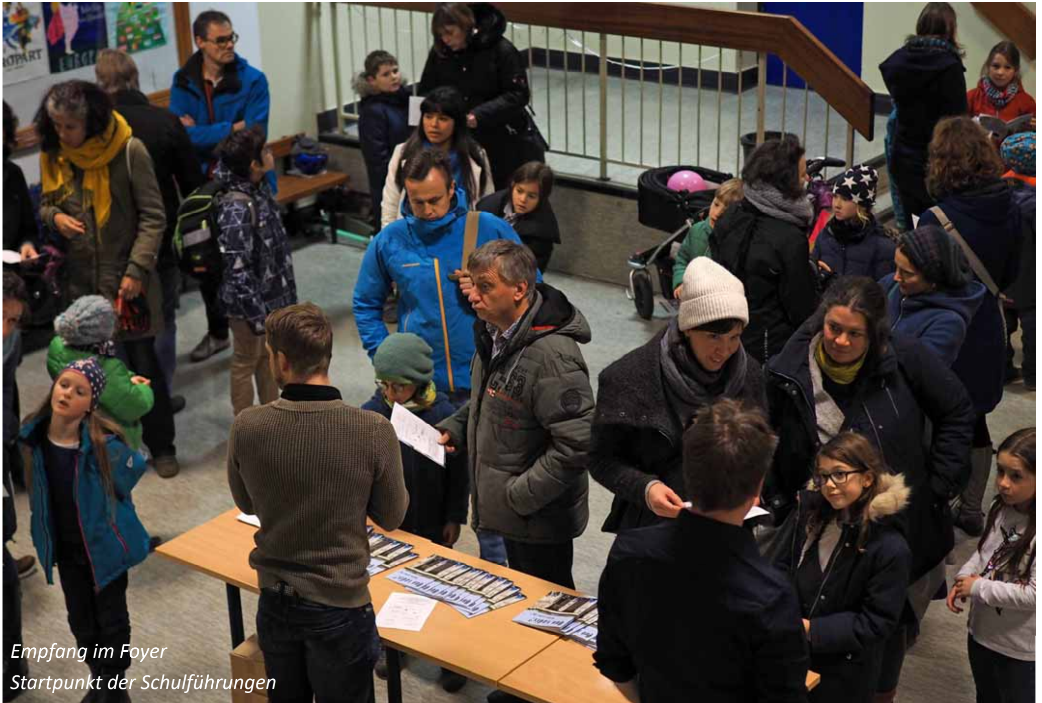
Empfang im Foyer Startpunkt der Schulführungen