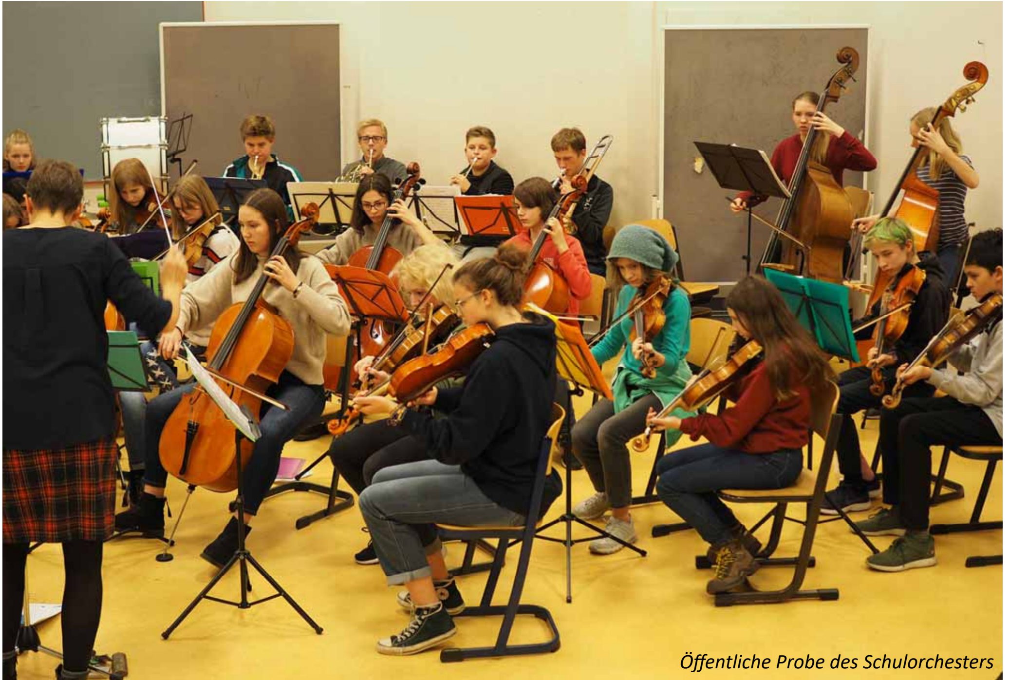
Öffentliche Probe des Schulorchesters