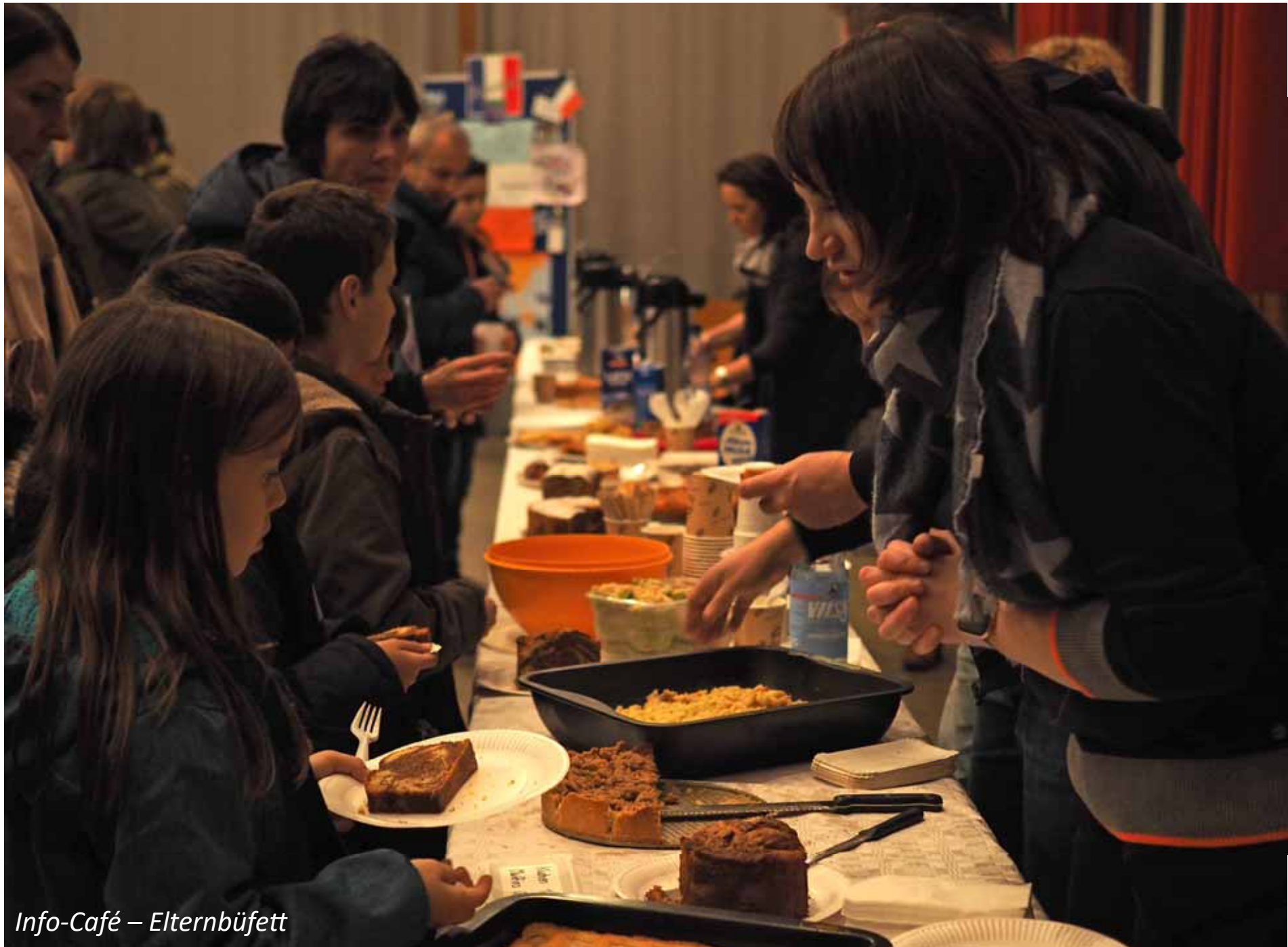
Info-Café – Elternbüfett