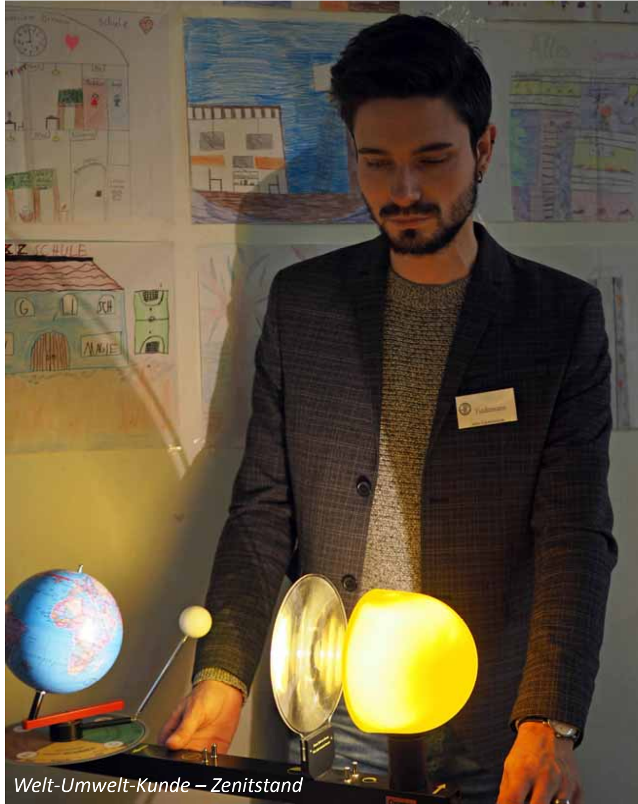
Welt-Umwelt-Kunde – Zenitstand