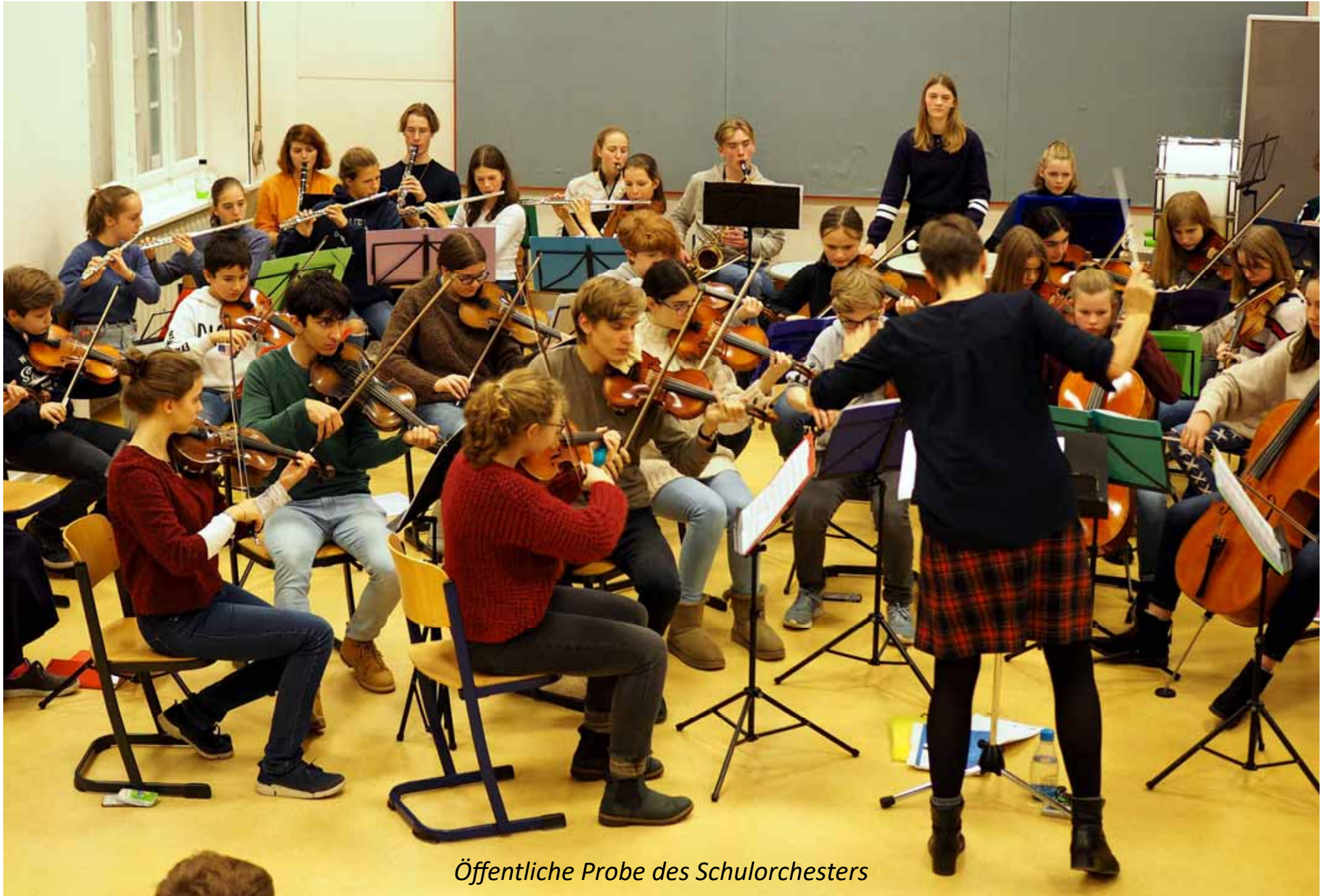
Öffentliche Probe des Schulorchesters