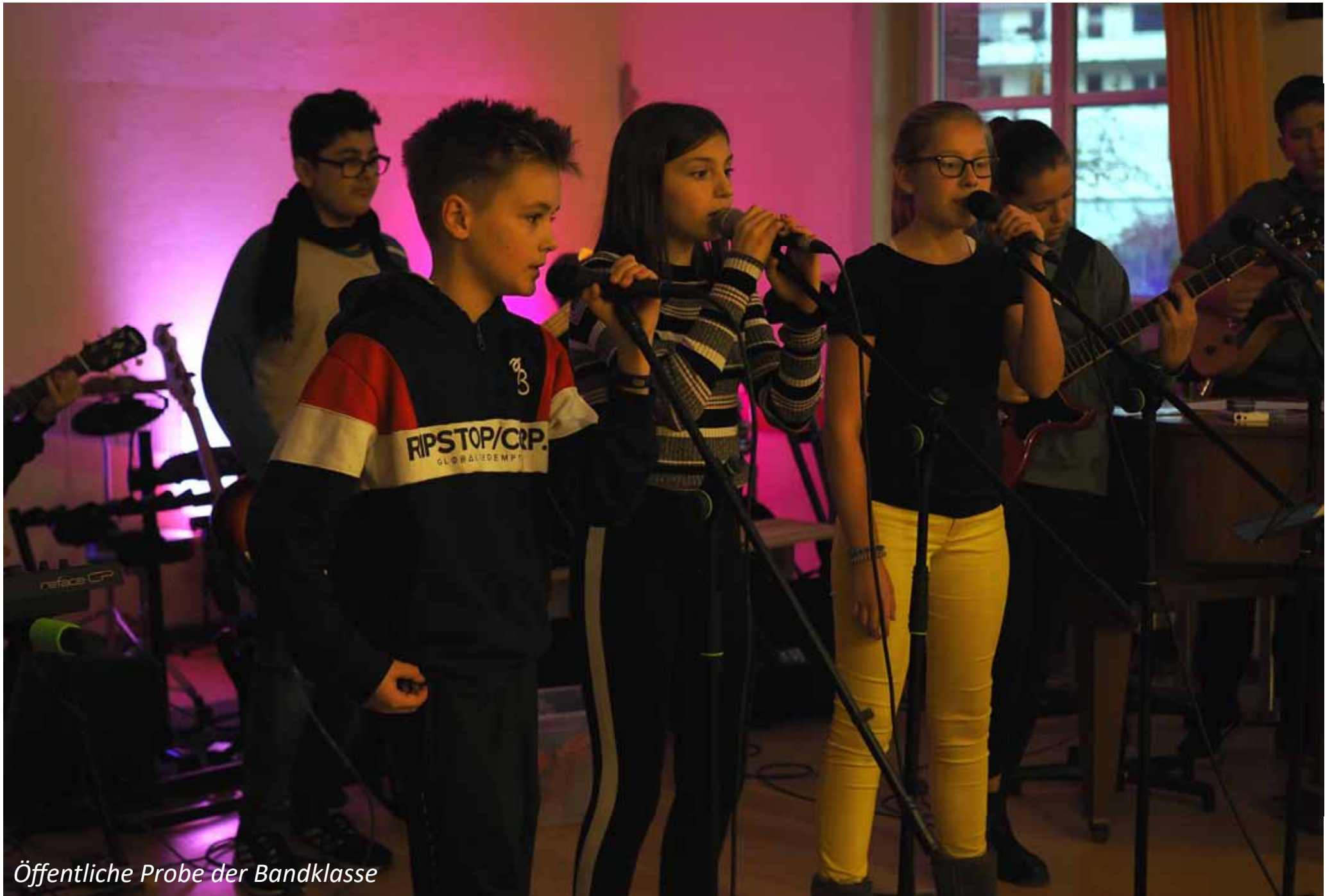
Öffentliche Probe der Bandklasse