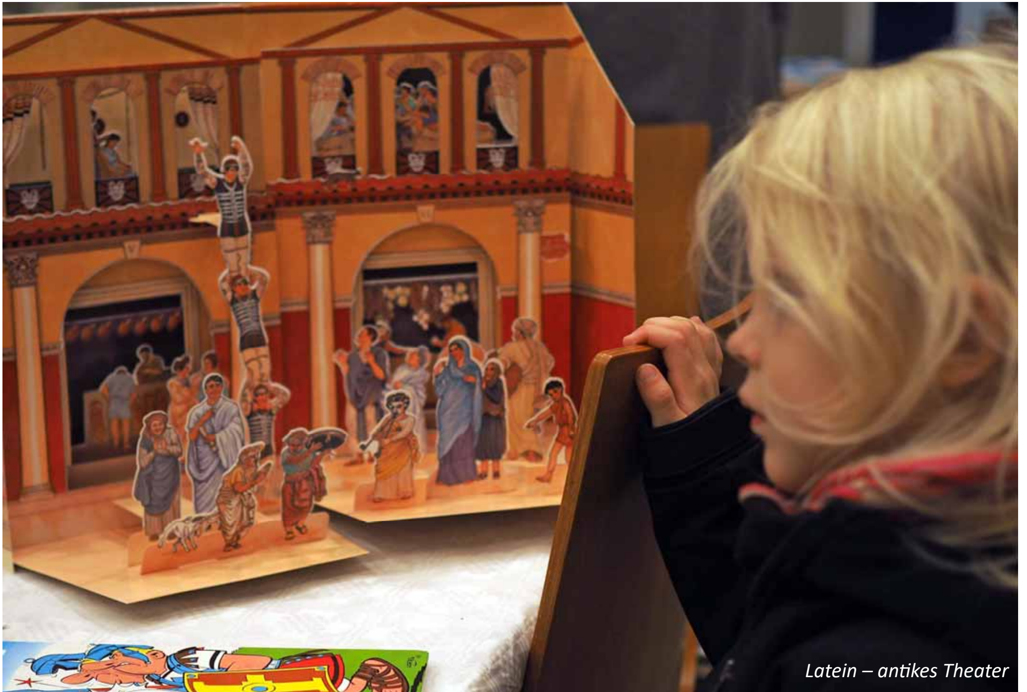
Latein – antikes Theater