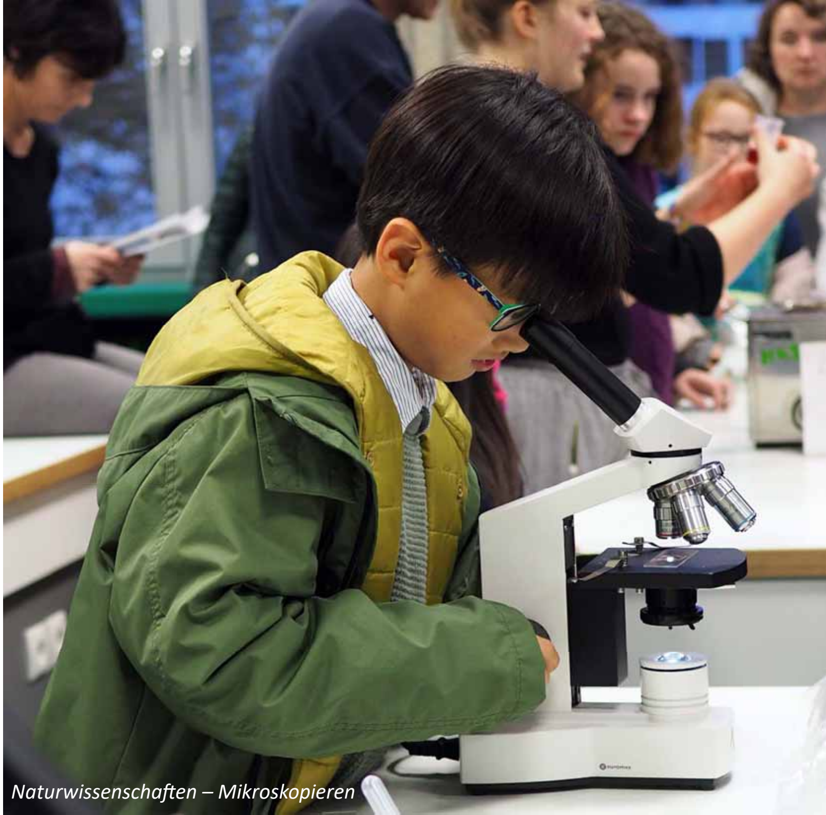
Naturwissenschaften – Mikroskopieren