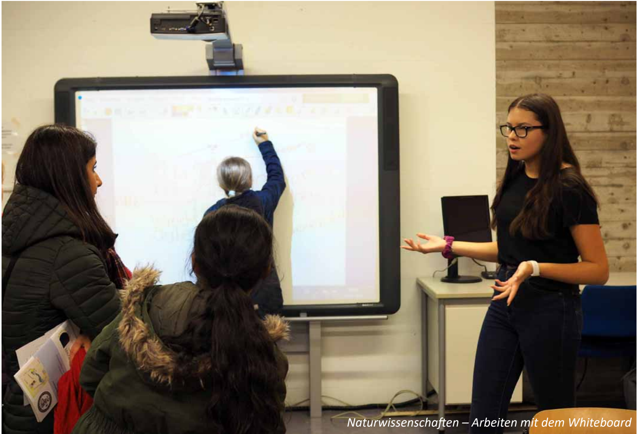
Naturwissenschaften – Arbeiten mit dem Whiteboard