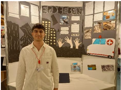
Melih D. Erdbeben: Umgang mit der Gefährdung durch Erdbeben in Südosteuropa am Beispiel der Türkei Geo- und Raumwissenschaften: JuFo Sondervortrag am Olbersplanetarium GEO-Jahresabonnement