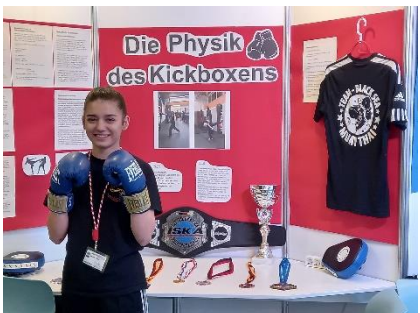
Zeyneb S. Die Physik des Kickboxens Physik Jufo