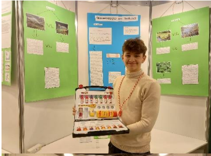
Janno F. Ökologischen Auswirkungen des Torfkansals auf die umgebende Tier- und Pflanzenwelt Biologie: JuFo