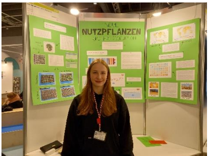
Mieke B. Neue Nutzpflanzen und ihre Produktion Biologie: JuFo