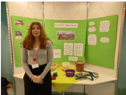
Liv G. Artgerechte Pferdehaltung Biologie: Schüex