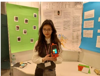
Wenjie C. Luftqualität Shanghai vs Bremen vs Paris Biologie: JuFo